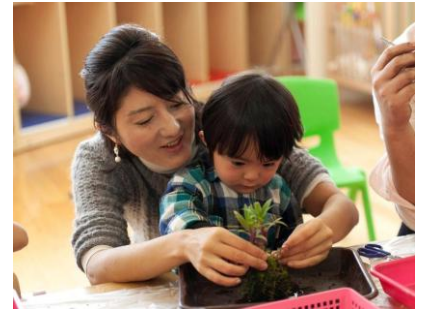
夏休みワークショップ 「こけ玉をつくろう！」