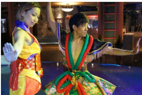
「MAIHAMA BON ODORI 和洋折衷」

熱気あふれるダンスステージや縁日など、「夏祭り」気分が楽しめるイクスピアリで、思い出に残る夏休みをお過ごしください。