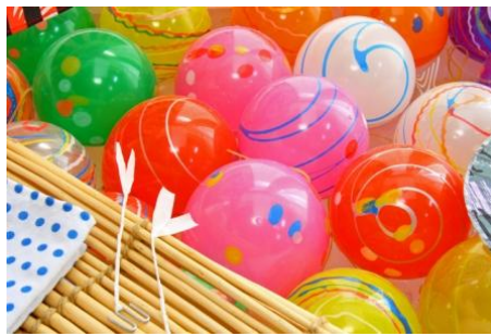
イクスピアリ・プチ縁日 「ヨーヨーつり」