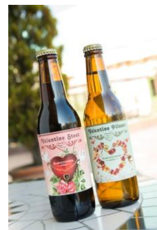
4F「ロティズ・ハウス」 ハーヴェスト・ムーン