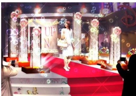
「ドレスアップ・ランウェイ」