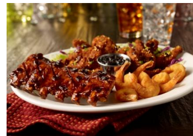
「フライデーズ シグネチャー サンプラー」 フライデーズシグネチャーリブ、 シュリンプフライ、チキンフライの盛合せ