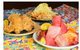
イクスピアリ限定メニューも