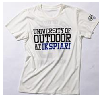
OUTDOOR PRODUCTS OFFICIAL STORE イクスピアリ×アウトドアプロダクツ コラボプリントTシャツ

各店舗のTシャツは、2Fトレイダーズ・パッセージに一堂に展示されます。限定デザインなど、数々の個性あふれるTシャツを見比べながら、イクスピアリでこの春夏のとおきのおきの一枚を探してみませんか？