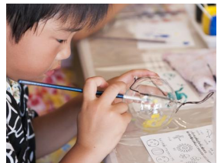
江戸風鈴絵付け体験