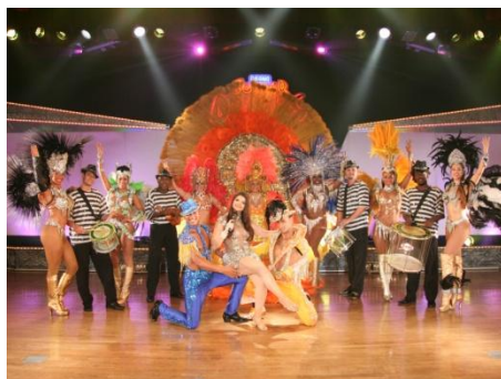
ワールドフェスティバル・ステージ