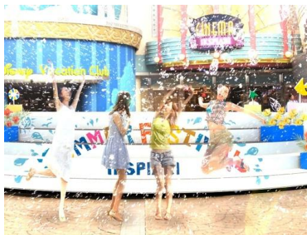
スプラッシュ・チャレンジ

大人も子どもも、誰と来ても「はしゃがずには、いられない」そんな夏休みイベント「イクスピアリ・サマーフェスティバル」で、最高に楽しい夏の思い出を作ってみてはいかがでしょうか。