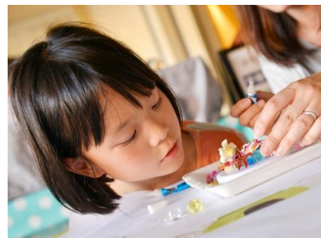
夏休みワークショップ