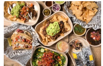
Guzman y Gomez

イクスピアリ内レストランでは、「イクスピアリ・サマーフェスティバル」に合わせ、この夏におすすめの世界のグルメをご提供します。8月5日に千葉初出店でオープンするメキシカンダイナー「Guzman y Gomez」をはじめ、台湾家庭小皿料理の「青龍門」や、イタリアンレストラン「Mare Cucina」など各店自慢のグルメでプチ世界旅行気分を味わってみませんか。