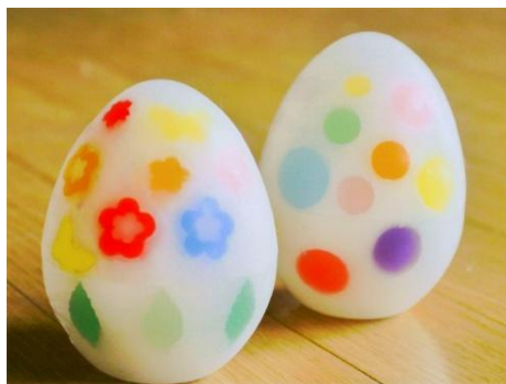
ワークショップ 「エッグキャンドル作り」