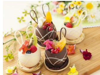
4/22 「親子で楽しむデザート クッキング教室」