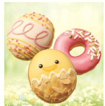
イースターメニュー 1F「クリスピー・クリーム・ドーナツ」