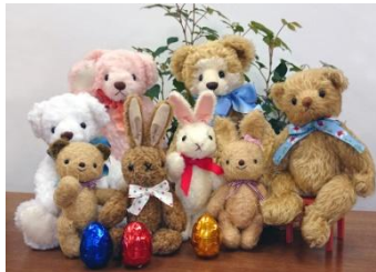
5/9～6/23 (6/23を除く、火曜定休) 「イースターバニー&ディベア作り」