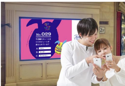
「150のトリビアハント」

今年の春は、お友達やご家族と一緒に、イースター気分を味わいに、イクスピアリへ遊びに来ませんか。