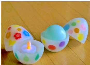
4/23～5/6 「エッグキャンドル作り」

15周年を記念してラインナップを充実させる体験講座「IKSPIARI Waku-Workshop」。イースター限定ワークショップとして、イースターバニーのぬいぐるみやタマゴ型のキャンドルを作るなど、さまざまな講座を開催します。さらに、イクスピアリで働くパティシエによる、親子でタマゴ型デザートにデコレーションをする講座も特別に開催します。