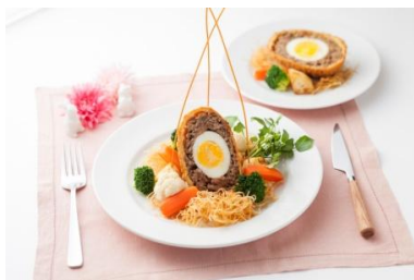
2F「カフェ・トレイル&トラック」

ショップやレストランでは、イースターシーズンにちなんで、タマゴやヒヨコ、ウサギなどをモチーフにしたグッズやメニューを取り揃え、イースター気分を盛り上げます。